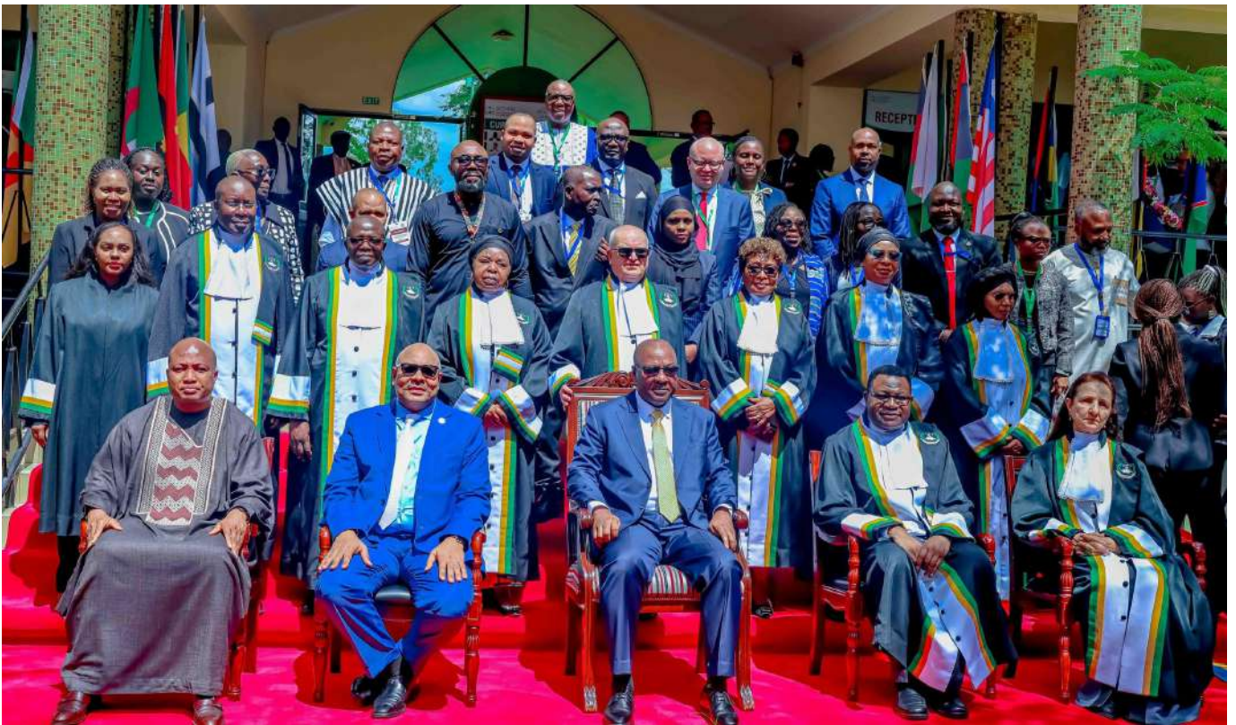
Mhe. John Dramani Mahama, Rais wa Jamhuri ya Ghana (aliyeketi katikati) akiwa kwenye picha ya pamoja na viongozi na wadau wa Mahakama ya Afrika ya Haki za Binadamu na Watu baada ya kufungua mwaka wa Mahakama hiyo Jijini Arusha.