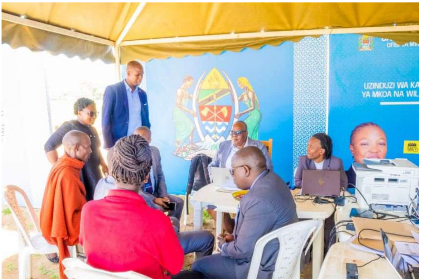
Baadhi ya Wananchi wa Mkoa wa Manyara wakipata msaada wa kisheria bila malipo wakati wa uzinduzi wa Kamati za Ushauri wa Kisheria ngazi ya Mkoa na Wilaya na Kliniki ya Sheria Bila Malipo.

Kliniki ya elimu na msaada wa kisheria bila Malipo iliratibiwa na kuendeshwa na Ofisi ya Mwanasheria Mkuu wa Serikali kuanzia tarehe 19 Januari, 2026 na kukamilika tarehe 25 Januari, 2026 mkoani Manyara wilaya ya Hanang’ katika viwanja vya Mount Hanang Katesh.