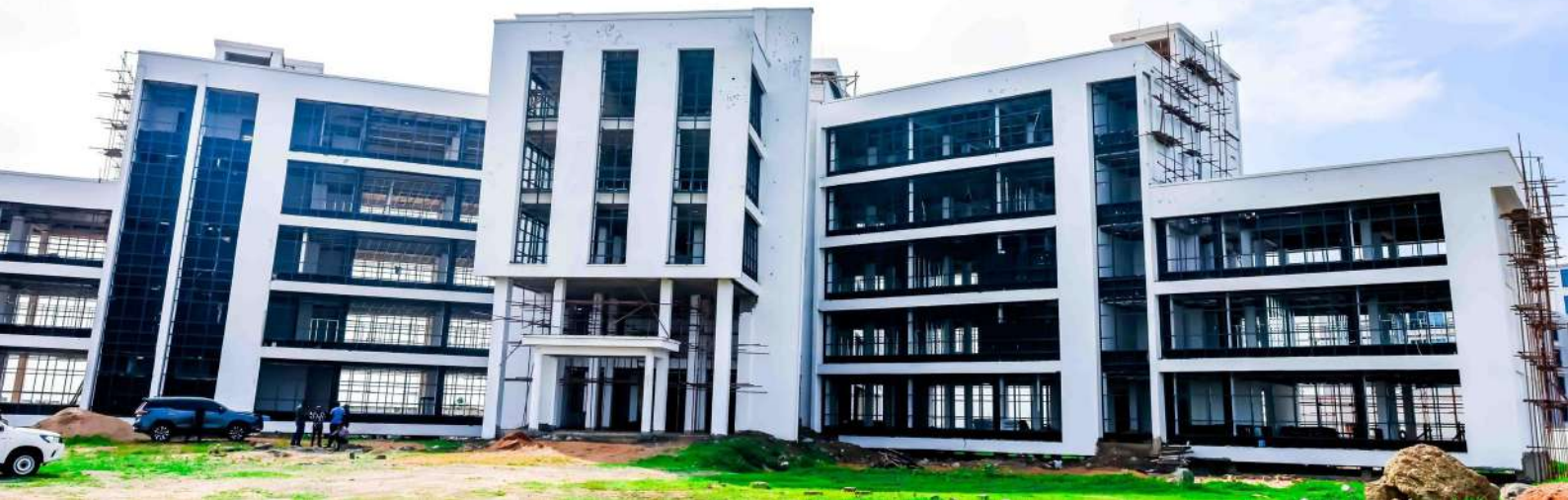
Muonekano wa jengo la Ofisi ya Wakili Mkuu wa Serikali linaloendelea kujengwa katika Mji wa Serikali, Mtumba - Dodoma.