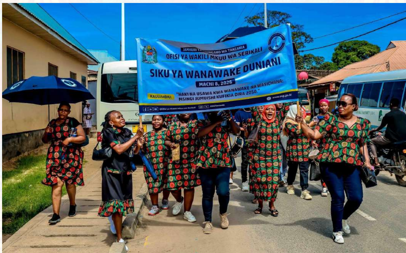
Baadhi ya wanawake wa Ofisi ya Wakili Mkuu wa Serikali wakielekea kushiriki Maadhimisho ya Siku ya Kimataifa ya Wanawake Duniani viwanja vya Barafu Mburahati Jijini Dar es Salaam .

Maadhimisho ya mwaka huu yaliongozwa na kauli mbiu isemayo, “Haki kwa wanawake na wasichana ni msingi wa maendeleo jumuishi kufikia Dira ya Taifa ya Maendeleo 2050.” Dhumuni la kauli mbiu hiyo ni kuhamasisha jamii kutambua umuhimu wa kuhakikisha wanawake na wasichana wanapata haki na fursa sawa katika elimu, uchumi na uongozi. Hatua hiyo itachangia kufanikisha maendeleo endelevu ya taifa.