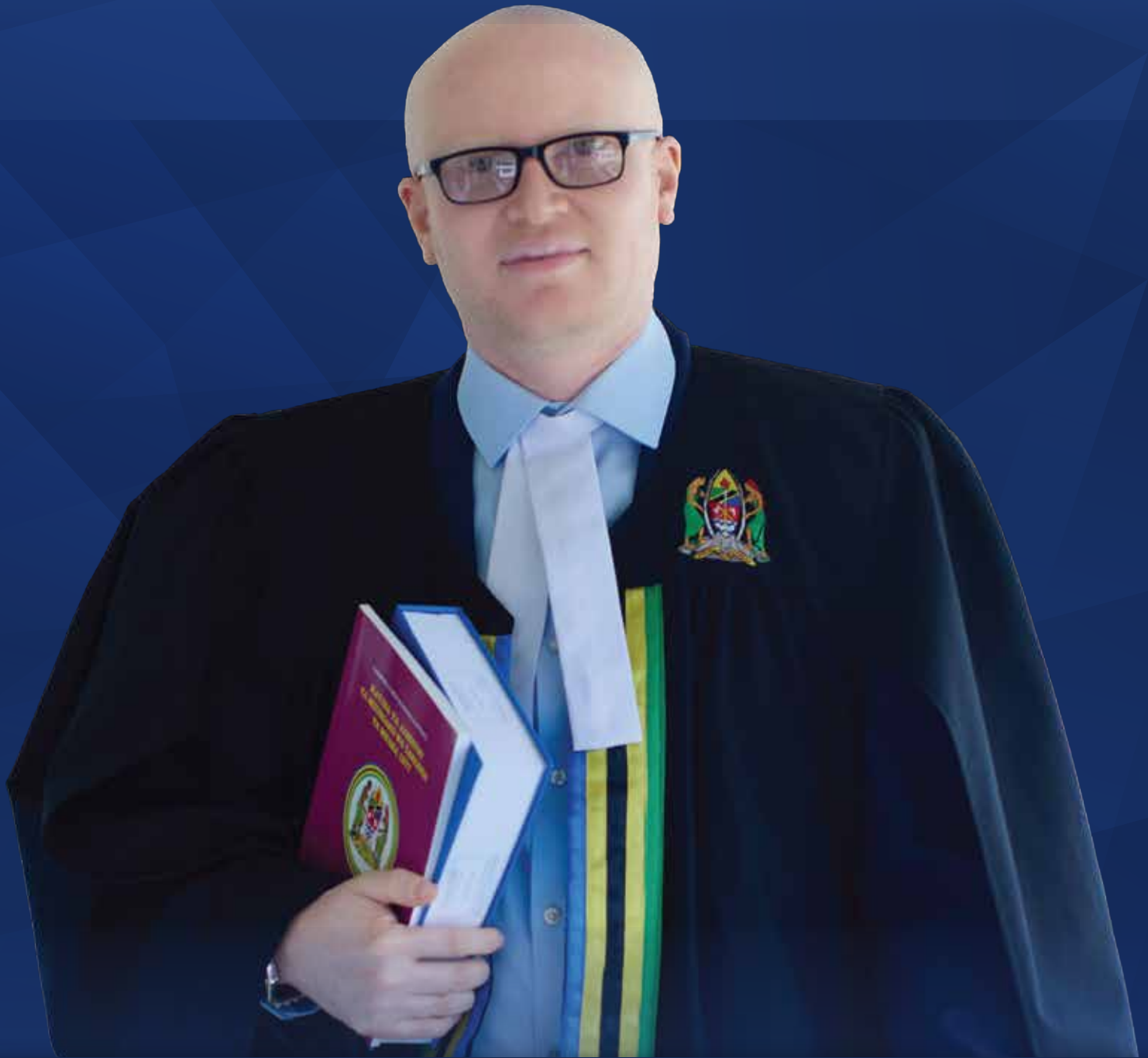
DKT. ALLY POSSI WAKILI MKUU WA SERIKALI

ISSN 2686 | Toleo la Kumi na Tano | Agosti - Novemba, 2025