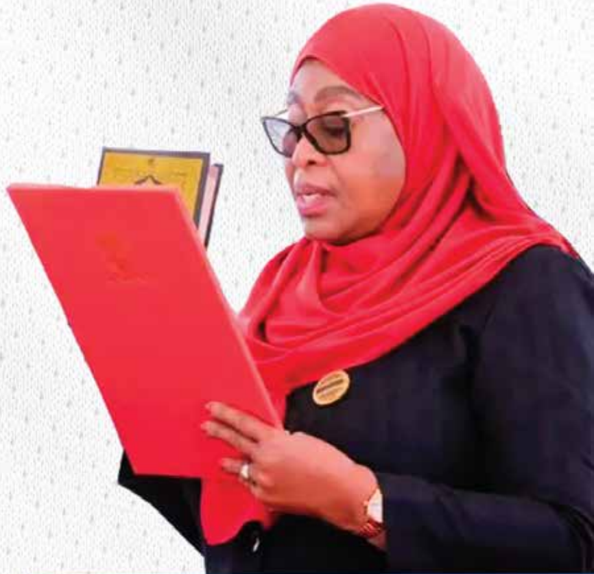
Mhe. Dkt. Samia Suluhu Hassan Rais wa Jamhuri ya Muungano wa Tanzania