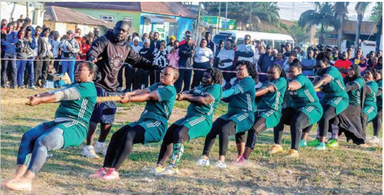
Wachezaji wa timu ya Kamba ya Wanawake wa Ofisi ya Wakili Mkuu wa Serikali wakivuta Kamba dhidi ya timu ya Wanawake wa Wizara ya Viwanda katika mchezo uliofanyika kwenye viwanja vya Furahisha Jijini Mwanza.

Timu ya mpira wa miguu ya Ofisi ya Wakili Mkuu wa Serikali imepangwa kundi E lenye timu za Mahakama ya Tanzania, Wizara ya Kilimo, OSHA na Wizara ya Madini, imeingia mawindoni kujinoa na mchezo unaofuata dhidi ya timu ya Mahakama ya Tanzania, katika mchezo unaotarajiwa kucheza kwenye uwanja wa Shule ya Sekondari ya Wavulana Bwiru iliyopo Jijini Mwanza.