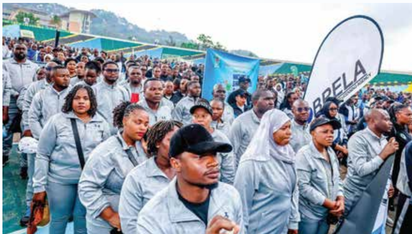
Wachezaji wa timu ya Wakili Mkuu wa Serikali, wakimsikiliza Naibu Waziri Mkuu wa Jamhuri ya Muungano wa Tanzania, Mhe. Dkt. Dotto Biteko wakati akifungua mashindano ya Shirikisho la michezo ya Wizara na Idara za Serikali (SHIMIWI) yaliyofanyika Jijini Mwanza.

Mashindano ya Michezo ya 39 ya SHIMIWI kwa mwaka 2025 yalihitimishwa Septemba 16, 2025, ambayo yaliyoongozwa na kaulimbiu isemayo, "Michezo kwa Watumishi Huongeza Tija Kazini, Jitokeze Kushiriki Uchaguzi Mkuu 2025 kwa Amani na Utulivu".