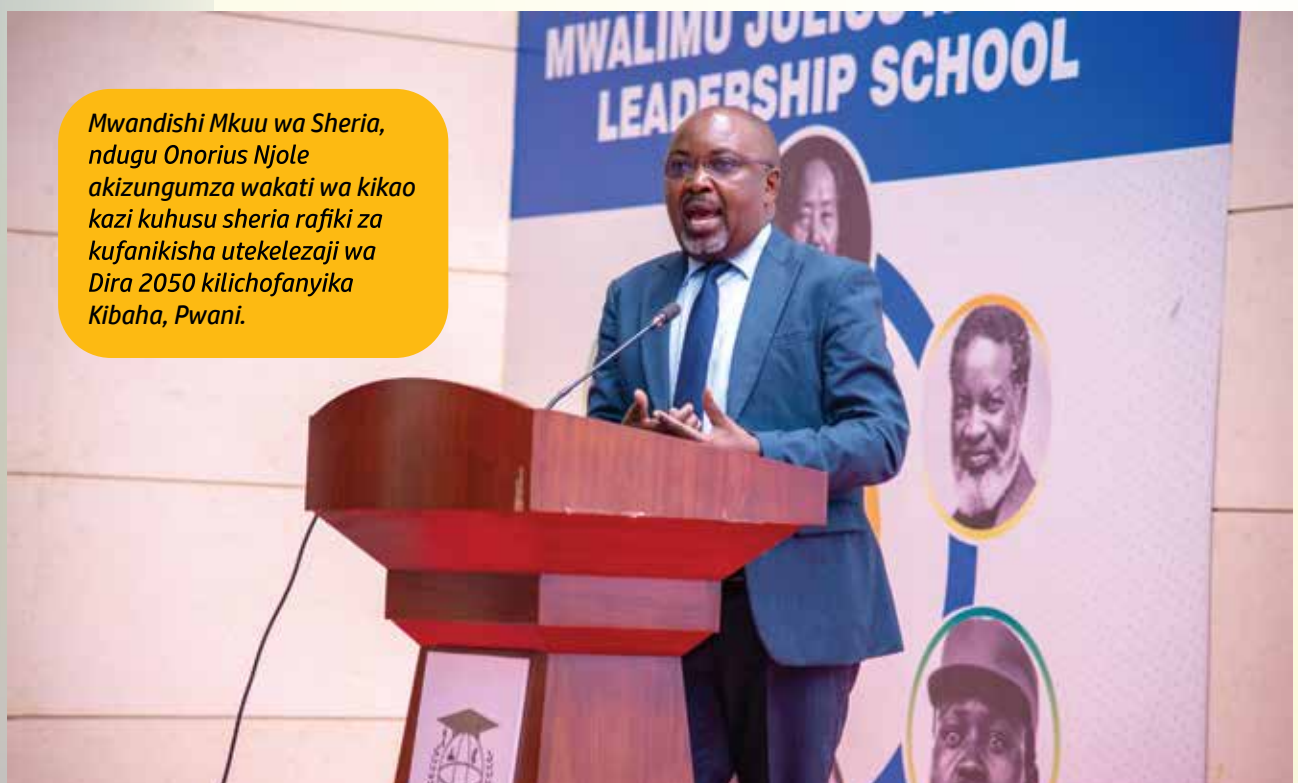
Mwandishi Mkuu wa Sheria, ndugu Onorius Njole akizungumza wakati wa kikao kazi kuhusu sheria rafiki za kufanikisha utekelezaji wa Dira 2050 kilichofanyika Kibaha, Pwani.