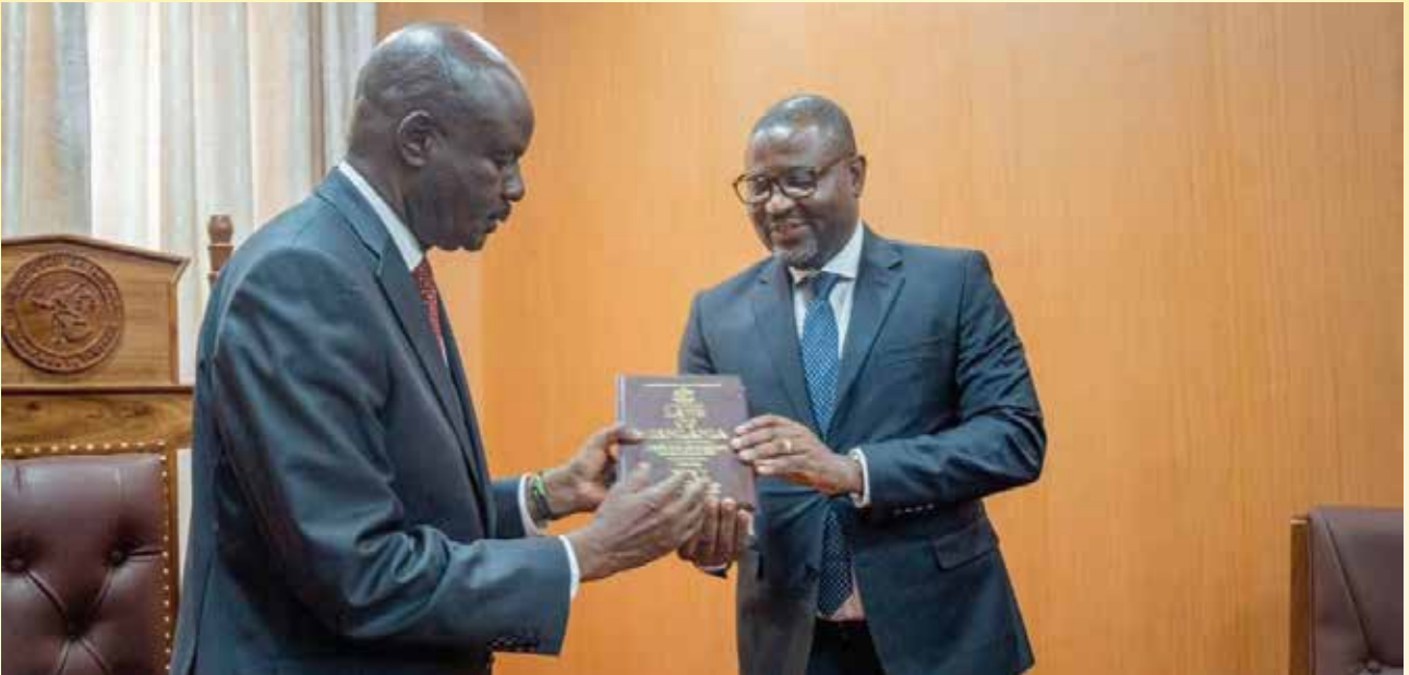
Mwanasheria Mkuu wa Serikali ya Jamhuri ya Muungano wa Tanzania, Mhe. Hamza Johari akimkabidhi Jaji Mkuu wa Mahakama ya Tanzania, Mhe. George Masaju juzuu ya sheria mbali mbali za nchi.

Tunahitaji kufanya tathmini madhubuti pindi amri au maamuzi mbalimbali yanapotolewa na Mahakama. Kama shauri tumeshindwa tuwahi kuwasilisha Notisi ya kukata rufaa na kuandika ushauri wa kisheria wa hatua stahiki za kufuata.