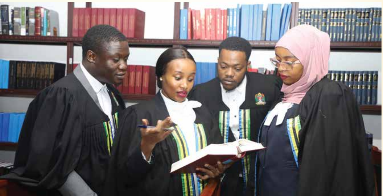
Baadhi ya Mawakili wa Serikali wa Ofisi ya Wakili Mkuu wa Serikali wakifanya utafiti kabla ya Kwenda Mahakamani kuendesha mashauri kwa niaba ya Serikali.