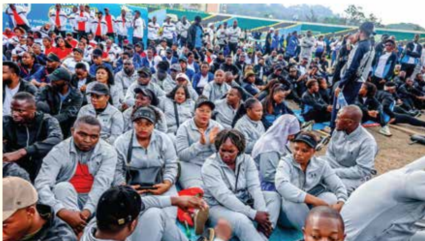
Wachezaji wa timu ya Wakili Mkuu wa Serikali, wakimsikiliza Naibu Waziri Mkuu wa Jamhuri ya Muungano wa Tanzania, Mhe. Dkt. Dotto Biteko wakati akifungua mashindano ya Shirikisho la michezo ya Wizara na Idara za Serikali (SHIMIWI) yaliyofanyika Jijini Mwanza.