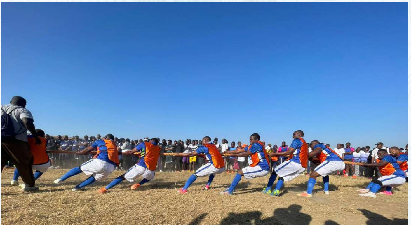
Timu ya kuvuta kamba ya wanaume ya Ofisi ya Wakili Mkuu wa Serikali ikichuana vikali na timu ya Ofisi ya Taifa ya Mashtaka (haipo pichani) katika mchezo wa kuvuta kamba kwenye mashindano ya SHIMIWI yaliyofanyika mkoani Iringa.