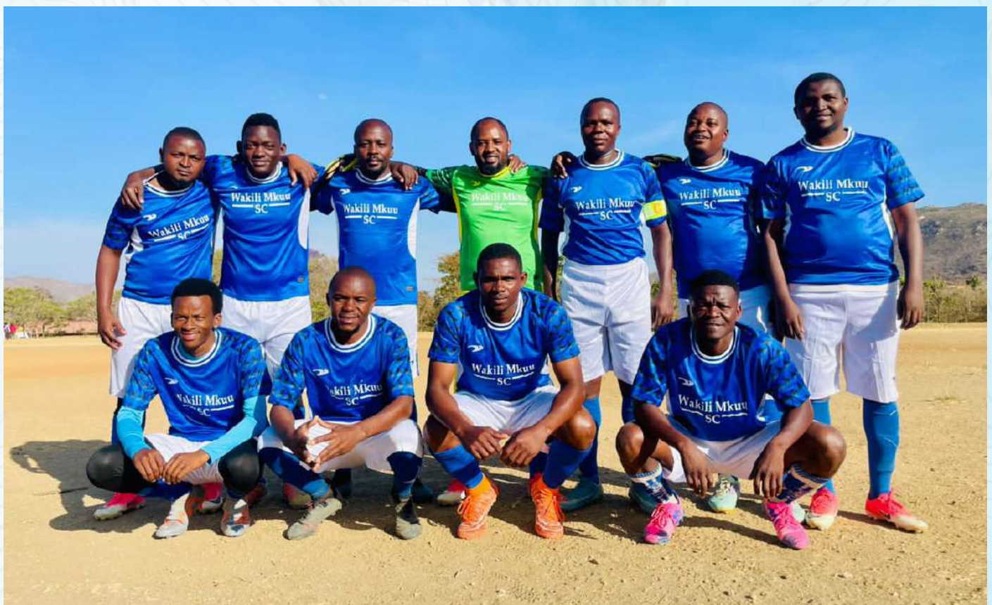
Timu ya mpira wa miguu ya Wakili Mkuu Sports Club ikiwa katika picha ya pamoja kabla ya mchezo wake na timu ya Wizara ya Ardhi, Nyumba na Maendeleo ya Makazi kabla ya kuanza kwa mtanange huo uliofanyika kwenye viwanja vya Chuo cha Mkwawa kilichopo mkoani Iringa.