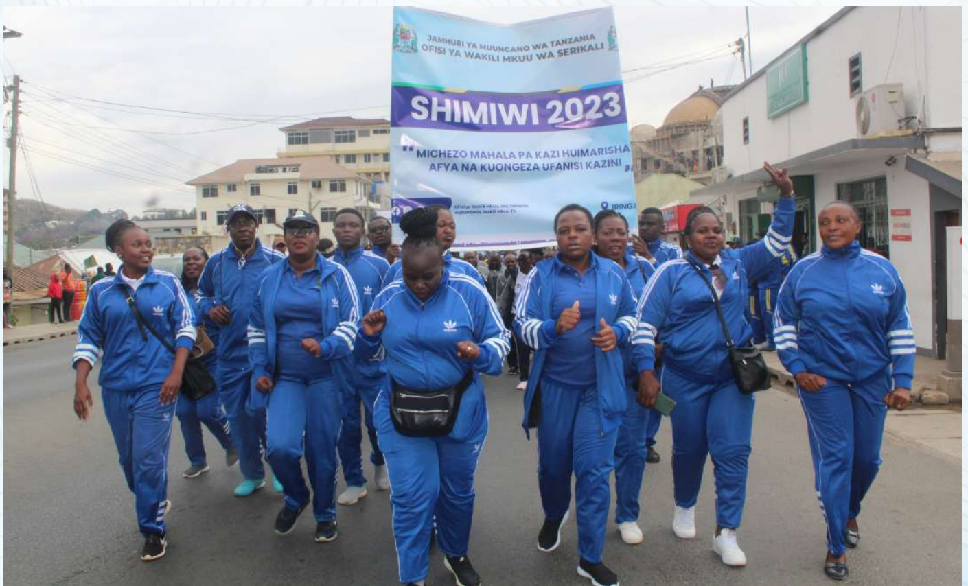
Baadhi ya watumishi wa Ofisi ya Wakili Mkuu wa Serikali wakishiriki maandamano ya ufunguzi wa Mashindano ya SHIMIWI yaliyofanyika mkoani Iringa.