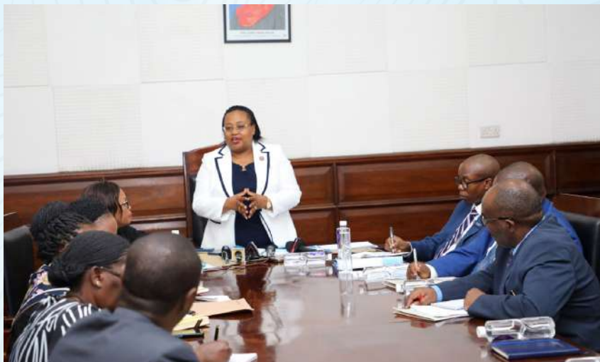
Waziri wa Katiba na Sheria, Mhe. Balozi Dkt. Pindi Chana (Mb) akizungumza na Menejimenti ya Ofisi ya Wakili Mkuu wa Serikali alipotembelea Ofisi hiyo akiwa kwenye ziara yake ya kikazi Jijini Dar es Salaam.