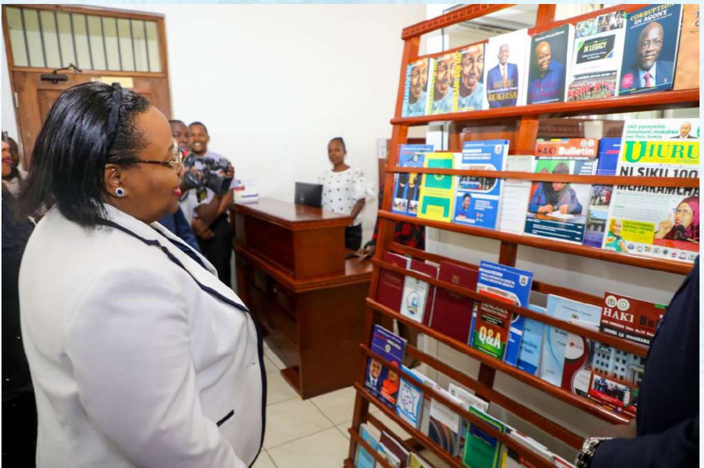
Waziri wa Katiba na Sheria, Mhe Balozi Dkt. Pindi Chana (Mb) akiangalia vitabu, nyaraka na majarida mbalimbali yaliyopo kwenye Maktaba ya Ofisi ya Wakili Mkuu wa Serikali wakati wa ziara yake kwenye Ofisi hiyo Jijini Dar es Salaam.

kisheria waliyoingia na mtoa huduma au mkandarasi bila kuishirikisha Ofisi ya Mwanasheria Mkuu wa Serikali hivyo kuzalisha migogoro inayokiuka sheria za mikataba, baadhi ya taasisi za Serikali zinachelewesha malipo ya huduma kwa wakandarasi hivyo kupelekea kufunguliwa kwa mashauri ya madai dhidi ya Serikali ambapo miradi hiyo ingesimamiwa vizuri ingeepuka milolongo ya kuiingiza Serikali katika madai na migogoro isiyoisha na baadhi ya taasisi kushindwa kutoa au kutoa ushirikiano hafifu wakati wa kuandaa nyaraka mbalimbali zinazohitajika mahakamani