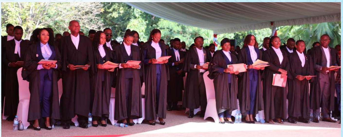
Sehemu ya Mawakili wapya waliokubaliwa na kupokelewa wakila kiapo cha uaminifu mbele ya Jaji Mkuu wa Tanzania, Mhe. Prof. Ibrahim Hamis Juma katika sherehe iliyofanyika katika Viwanja vya Karimjee jijini Dar es Salaam.