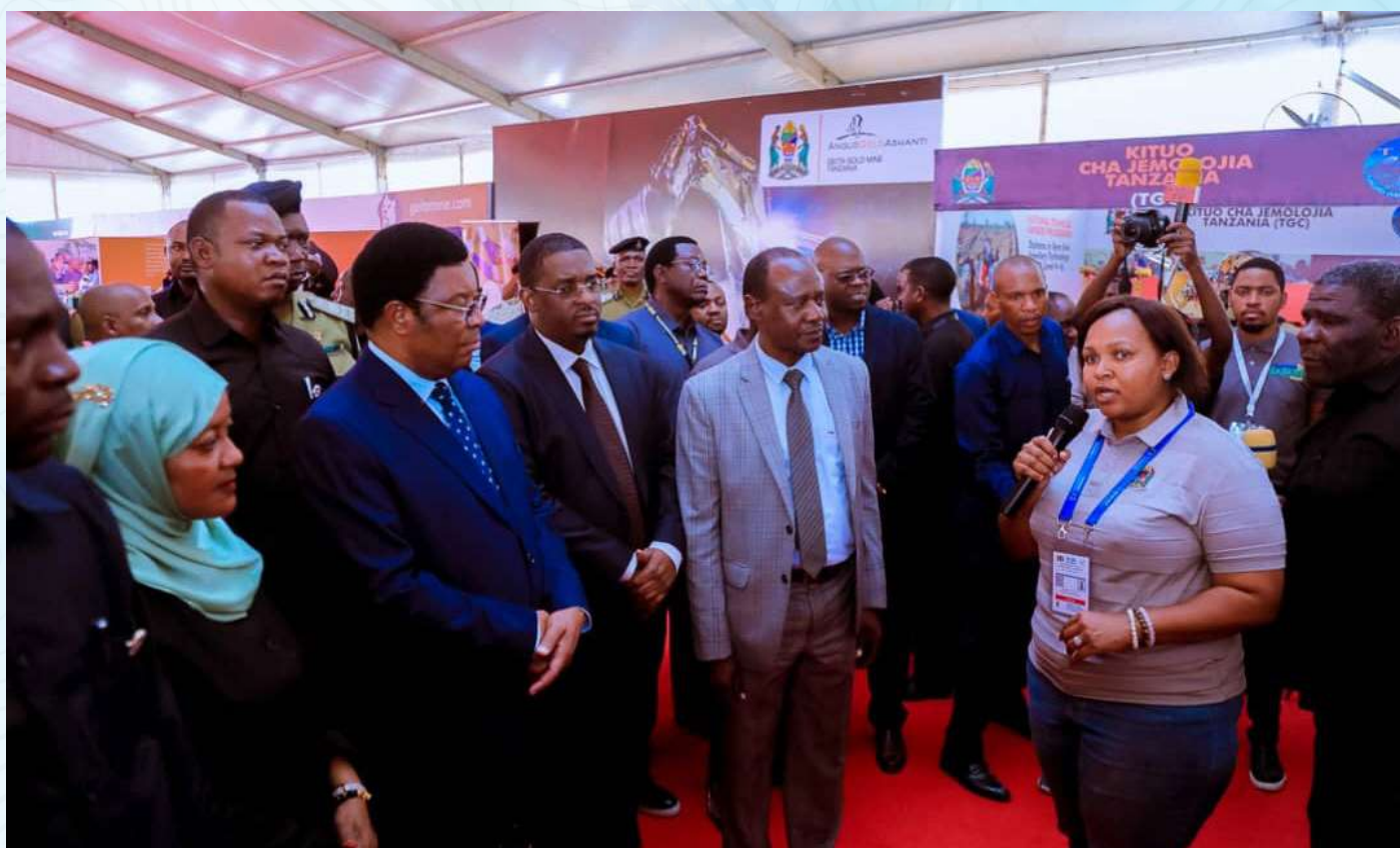
Waziri Mkuu wa Jamhuri ya Muungano wa Tanzania Mhe.Kassim Majaliwa akitembelea mabanda katika Maonesho ya 47 ya Kimataifa ya Biashara, yaliyofanyika kwenye Viwanja vya Manonesho vya Sabasaba, jijini Dar es Salaam.