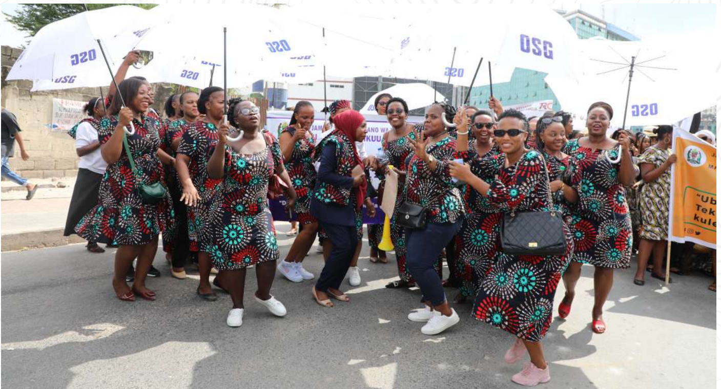
Baadhi ya wanawake kutoka Ofisi ya Wakili Mkuu wa Serikali wakisherehekea kilele cha Maadhimisho ya Siku ya Wanawake Duniani yaliyofanyika katika Viwanja vya Mnazi Mmoja Jijini Dar Es Salaam.

Alifafanua kuwa nchi yetu pia inatambua umuhimu na mchango wa mwanamke katika siasa, jamii na uchumi hivyo mwaka huu nchi yetu inaungana na nchi nyingine duniani kuadhimisha Siku ya Wanawake kama ambavyo na sisi mkoa wa Dar es Salaam tunaadhimisha siku hii muhimu.