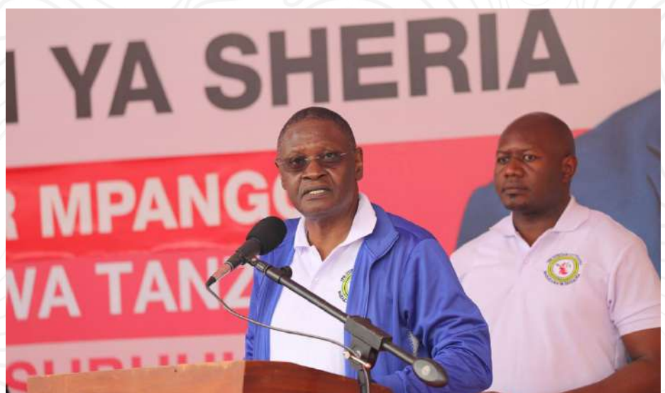
Jaji Mkuu wa Mahakama ya Tanzania, Mhe. Prof. Ibrahimu Hamis Juma akihutubia wakati wa uzinduzi wa Wiki ya Sheria kwenye Viwanja vya Nyerere Square jijini Dodoma.

Katika wiki hiyo Ofisi ya Wakili Mkuu wa Serikali ilishiriki katika kufanya yafuatayo:- Kutoa elimu ya Sheria kwa umma kuhusiana na masuala mbalimbali yanayoihusu Ofisi ya Wakili Mkuu wa Serikali na utekelezaji wa majukumu yake. Elimu hiyo kwa umma ilitolewa kwa njia mbalimbali ikiwemo, kutembelea masoko, mashule, magereza na kwenye vyombo vya Habari pamoja na ugawaji wa vipeperushi, majarida kwa wadau waliotembelea banda la Ofisi. Kupitia maonyesho ya kwenye mabanda ufafanuzi ulitolewa kwenye maeneo kama sheria za ardhi, kazi, mikataba, usuluhishi n.k.