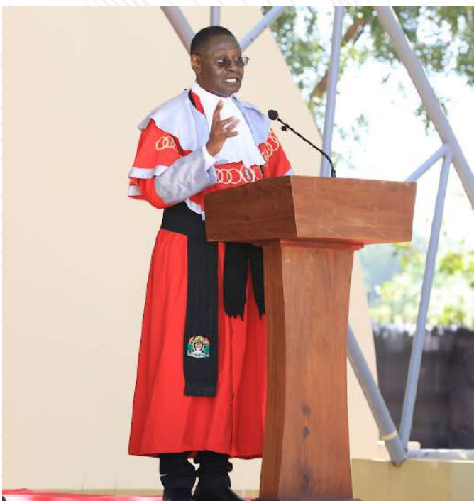
Jaji Mkuu wa Mahakama ya Tanzania, Mhe. Prof. Ibrahim Hamis Juma akizungumza na viongozi na watumishi pamoja na wananchi (hawapo pichani) walioshiriki sherehe za kilele cha Siku ya Sheria nchini tarehe 01 Februari, 2023 katika Viwanja vya Chinangali jijini Dodoma.