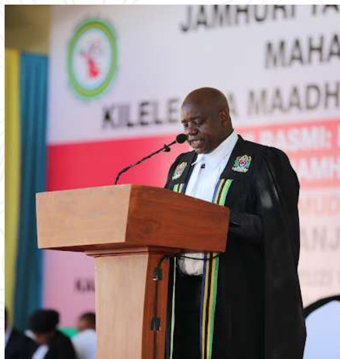
Mwanasheria Mkuu wa Serikali, Mhe. Dkt. Eliezer Mbuki Feleshi akisoma hotuba yake katika Sherehe za Maadhimisho ya kilele cha Siku ya Sheria nchini yaliyofanyika Jijini Dodoma.