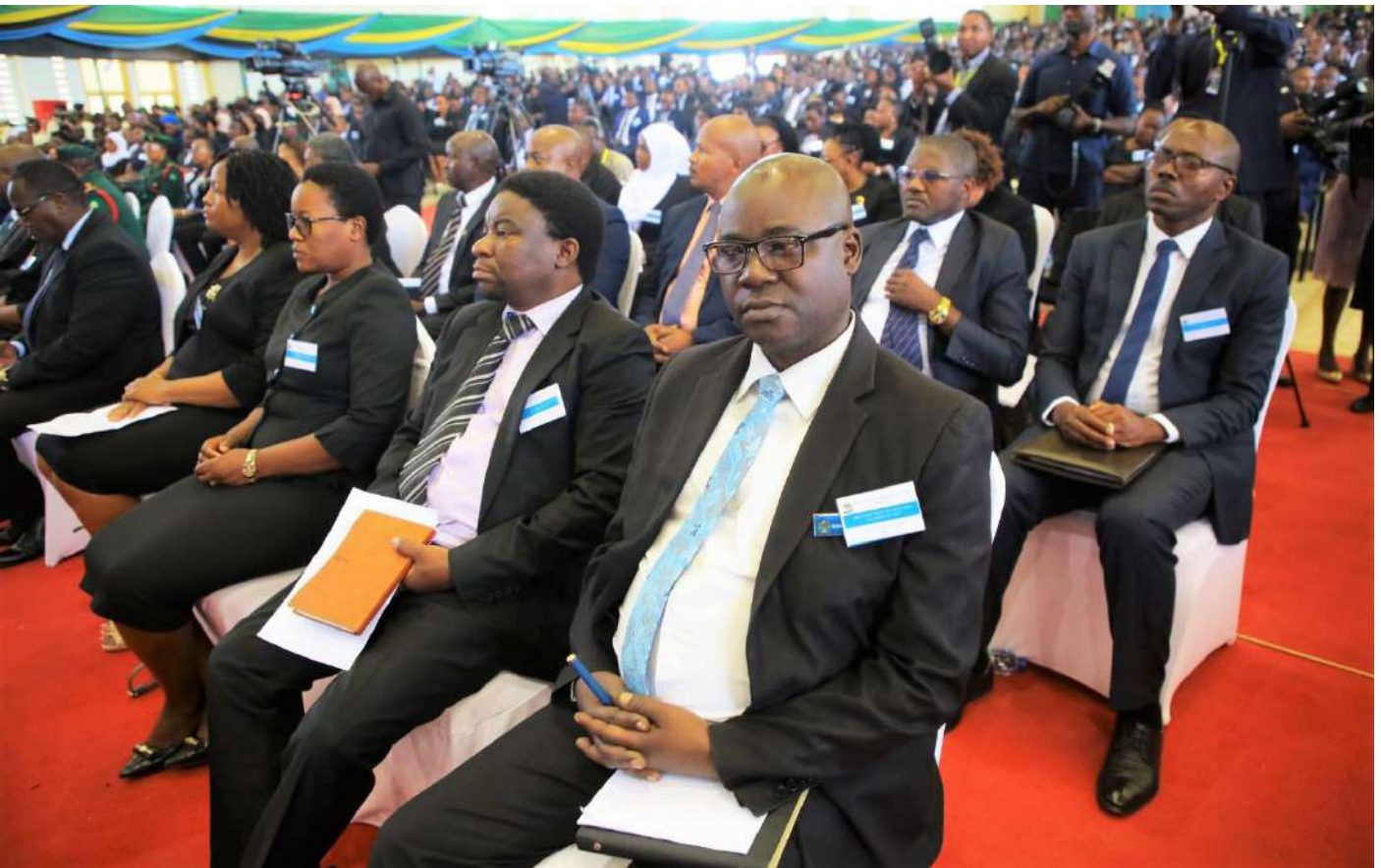
Baadhi ya Wakurugenzi wa Ofisi ya Wakili Mkuu wa Serikali (walioketi mbele) wakimsikiliza kwa makini Rais wa Jamhuri ya Muungano wa Tanzania, Mhe. Samia Suluhu Hassan (hayupo pichani) wakati wa ufunguzi Mkutano na uzinduzi wa Chama cha Mawakili wa Serikali uliofanyika jijini Dodoma Septemba, 2022.