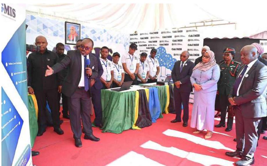
Rais wa Jamhuri ya Muungano wa Tanzania Mhe. Samia Suluhu Hassan akitembelea mabanda mbalimbali likiwemo la Ofisi ya Mwanasheria Mkuu wa Serikali kujionea shughuli mbalimbali pamoja na huduma zitolewazo na Ofisi hizo kabla ya kuhutubia na kuzindua Rasmi Chama cha Mawakili wa Serikali, nembo na Mfumo rasmi wa Ofisi ya Mwanasheria Mkuu wa Serikali.