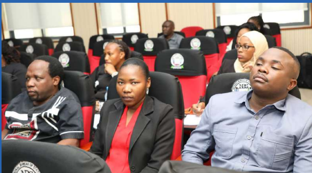
Baadhi ya wajumbe wa Baraza la Wafanyakazi wa Ofisi ya Wakili Mkuu wa Serikali wakifuatilia hotuba ya ufunguzi wa Mkutano wa Baraza la Wafanyakazi la Ofisi ya Wakili Mkuu wa Serikali wakati wa ufunguzi wa Baraza hilo uliofanyika Septemba, 2022 jijini Dodoma.