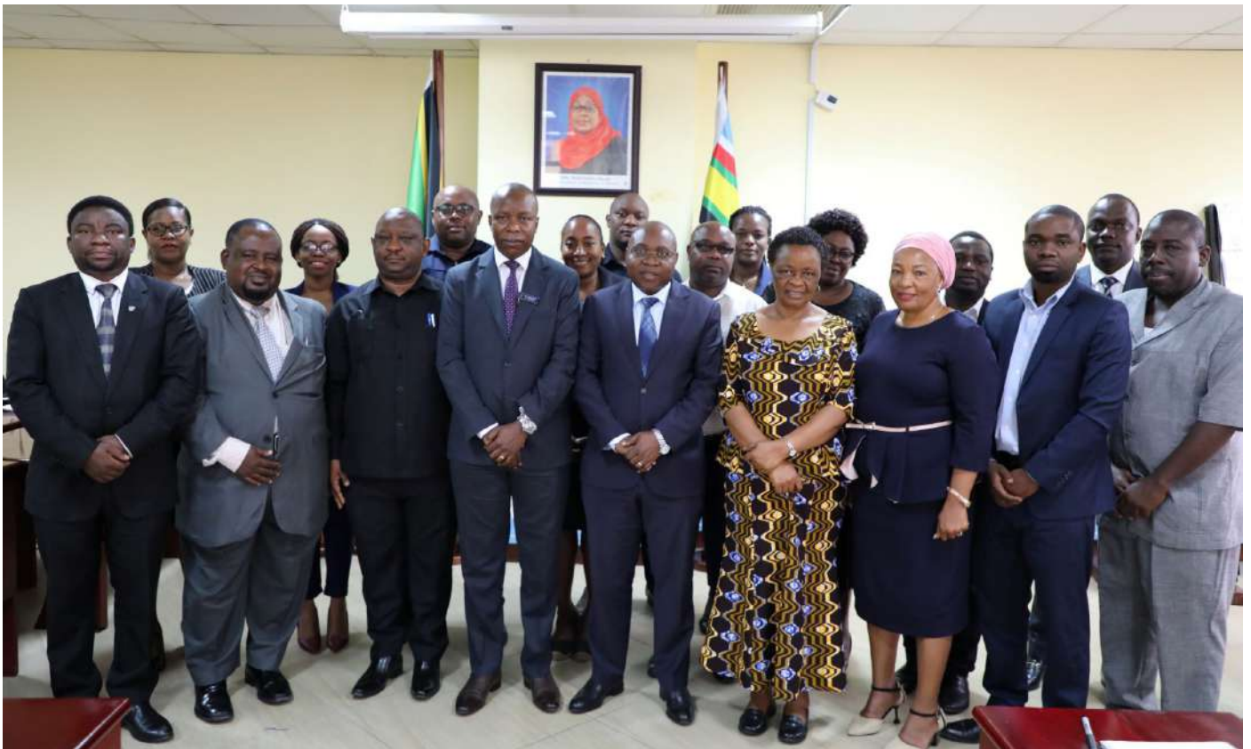
Waziri wa Katiba na Sheria Mhe. Dkt. Damasi Ndumbaro (Mb) (aliyesimama mbele katikati) akiwa kwenye picha ya pamoja na Menejimenti ya Ofisi ya Wakili Mkuu wa Serikali baada ya kikao kazi na Ofisi hiyo kilichofanyika mwezi Agosti, 2022 jijini Dar es Salaam.