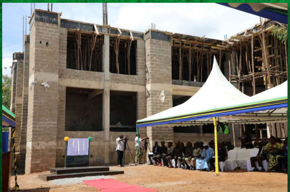
Picha ya muonekano wa jengo jumuishi la taasisi za sheria linalojengwa eneo la Buswelu wilayani Ilemela mkoani Mwanza kwa ajili ya matumizi ya watumishi wa Ofisi ya Mwanasheria Mkuu wa Serikali, Ofisi ya Taifa ya Mashtaka na Ofisi ya Wakili Mkuu wa Serikali wa mkoa huo.