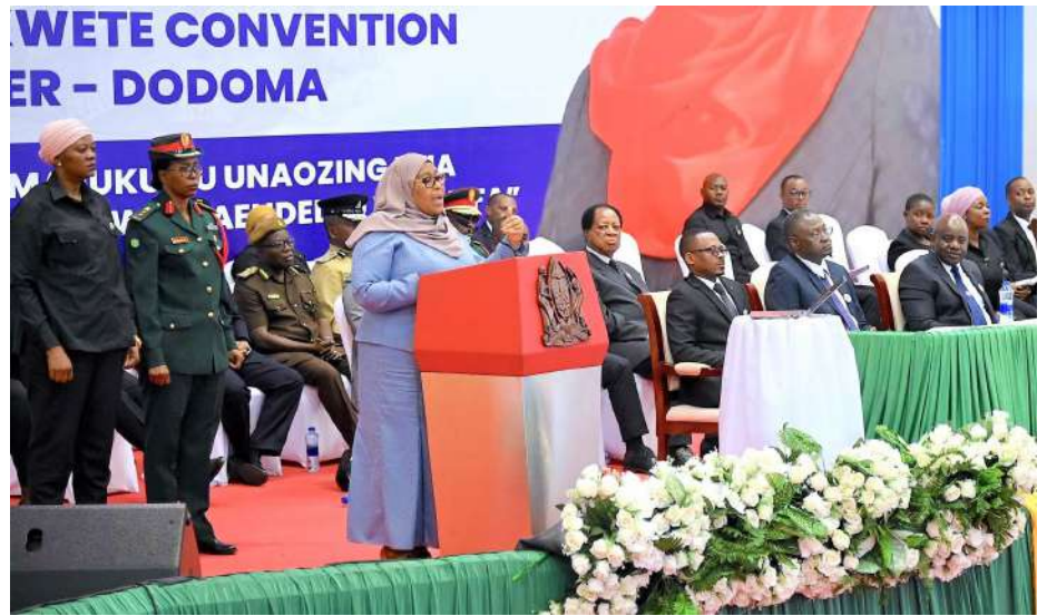
Rais wa Jamhuri ya Muungano wa Tanzania Mhe. Dkt. Samia Suluhu Hassan akizungumza na Viongozi mbalimbali pamoja na Mawakili wa Serikali kabla ya kuzindua Chama cha Mawakili wa Serikali, nembo na Mfumo rasmi wa Ofisi ya Mwanasheria Mkuu wa Serikali katika hafla iliyofanyika Septemba, 2022 Jijini Dodoma.

Mhe. Rais Dkt. Samia alipongeza uanzishwaji wa Chama cha Mawakili wa Serikali cha kitaaluma na kusema uwepo wake utasaidia zoezi la kuratibu utendaji kazi wa Mawakili wote wa Serikali walio katika utumishi wa umma nchini na amewaeleza kuwa wamepata mlezi mzuri ambaye ni Mwanasheria Mkuu wa Serikali anayeweza kuwasemea katika masuala yao ya kitaaluma, kikazi, kinidhamu na kimaslahi.