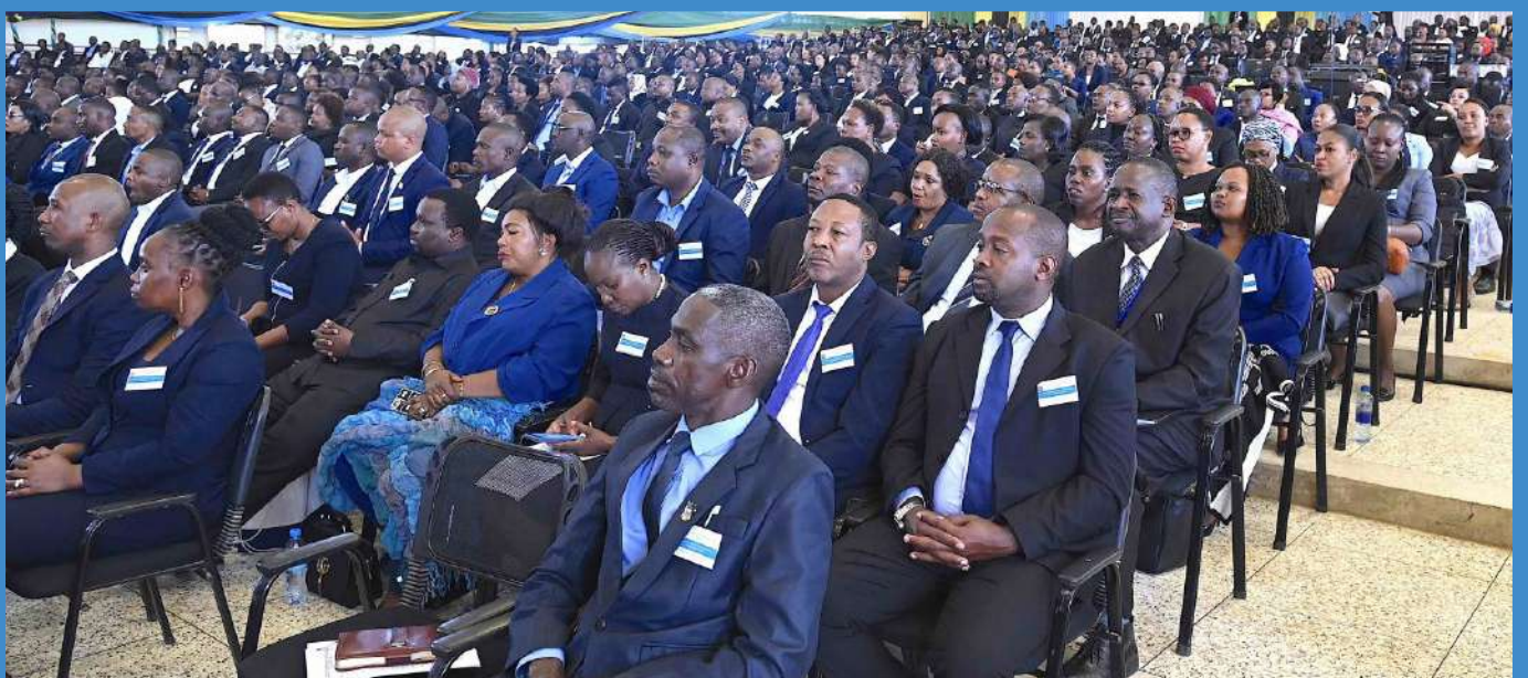
Viongozi mbalimbali pamoja na Mwakili wa Serikali wakiwa kwenye ukumbi wa Mikutano wa Jakaya Kikwete kwa ajili ya kushiriki Mikutano Mkuu wa Mwakili wa Serikali uliofanyika jijini Dodoma Septemba, 2022.